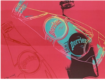
Publicité d'Andy Warhol pour Perrier, 1983.