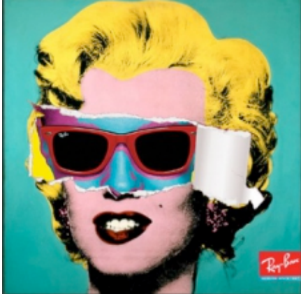
Publicité de l'agence Cutwater pour Ray Ban, 2009