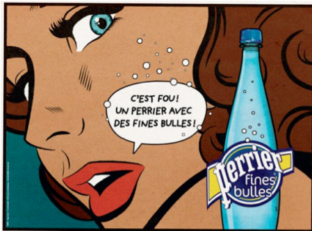
Publicité de l'agence Ogilvy pour Perrier, 2012.