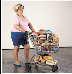
Supermarket Lady, 1969