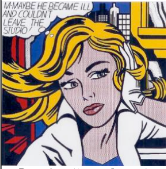
Peut-être (jeune femme), 1965

L'Hyperréalisme cherche à « faire plus vrai que vrai ». Que ce soit en peinture ou en sculpture, les artistes imitent à la perfection la réalité. Duane Hanson ne cherche pas à embellir la nature, il la représente telle qu'elle est : Supermarket lady n'a rien de la sexy Marilyn et représente pourtant, elle aussi, la société de consommation.