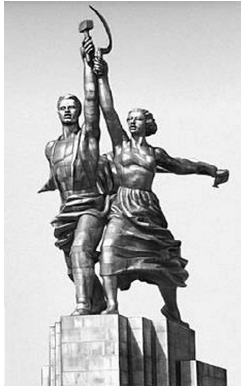
Paris 1937. lors de l'exposition internationale de 1937. Au pied du palais de Chaillot (arrière plan au centre) on voit à gauche le pavillon soviétique précédé de la gigantesque sculpture de Vera Moukhina, l'ouvrier et la kolkhozienne, et à droite le pavillon de l'Allemagne nazie surmonté d'un aigle, prémonitoire face à face.