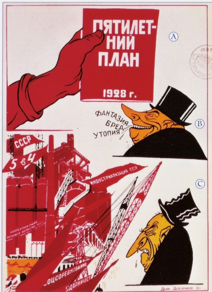
1. Le succès du premier plan quinquennal. Affiche, 1932.